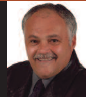
ROGER BUJEAU URBANISME