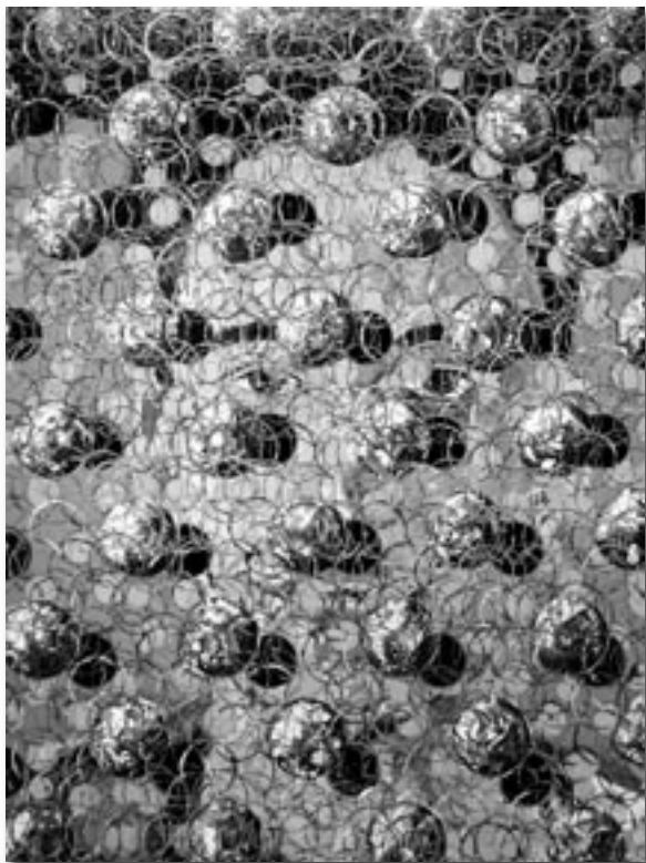
Will be • 48" x 36", acrylique sur toile