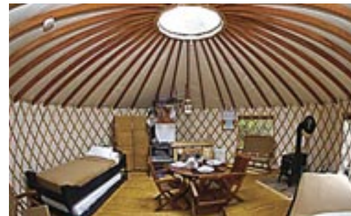
Une expérience inoubliable en yourte les 5 et 6 mars prochain. PARC NATIONAL DU BIC STEVE DESCHÊNES, SÉPAQ

Voulez-vous vivre une expérience hors du commun? Venez passer un week-end en yourte avec nous. La yourte est une espèce de tente ronde originaire de la Mongolie. Contrairement à la cabane en bois rond, le confort est compris dans le concept. On a donc droit à une tente à double paroi incluant du mobilier. L'extérieur n'a rien à envier à l'intérieur puisqu'on