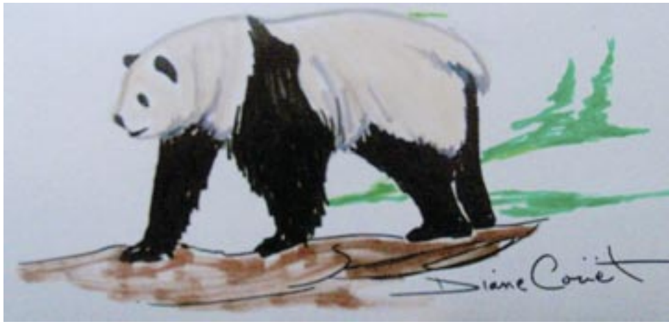
L'ours Panda. AQUARELLE DE DIANE COUËT

C'est en 1972 que le gouvernement chinois a légué une paire de Pandas géants ( Ailuropoda melanoleuca ) au Zoo National du Smithsonian, à Washington, DC.