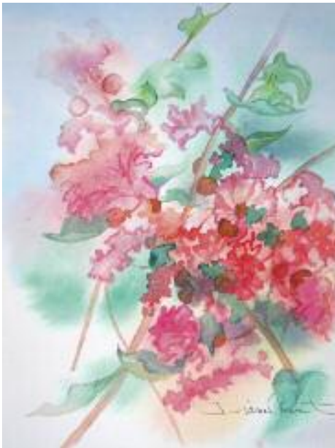
Aquarelle signée Diane Couët

Pendant mon séjour, j'ai découvert un très bel arbre de la famille des Lythracées. Cette famille comprend un représentant bien connu au Québec, la Salicaire d'Europe. Cette plante aux très belles fleurs magenta est considérée très envahis-