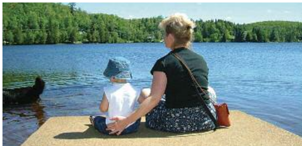
Position repos... à leur façon.

Lorsqu'on parle de des adultes des vacances d'été de leur enfance, il y a souvent la nostalgie de celles passées chez les grands-parents. Que ce soit à la campagne, à la ferme, en camping, en sorties spéciales ou à la maison, les moments passés avec les grands-parents furent toujours mémorables. La