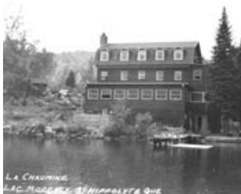
La Chaumine