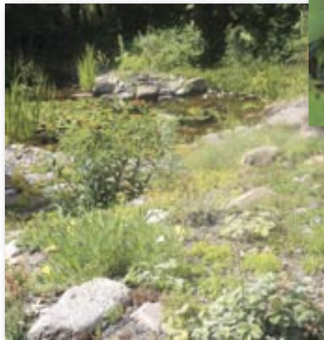
Aux abords de l'étang.