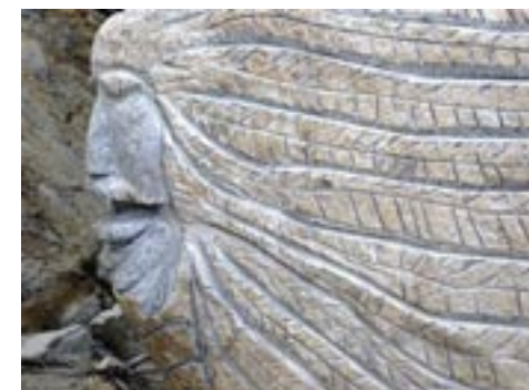
Oeuvre de Jacques Corbeil

L'inauguration officielle du Sentier Art-Nature aura lieu le samedi 20 août, à partir de 13 h 30, au pavillon Roger-Cabana.