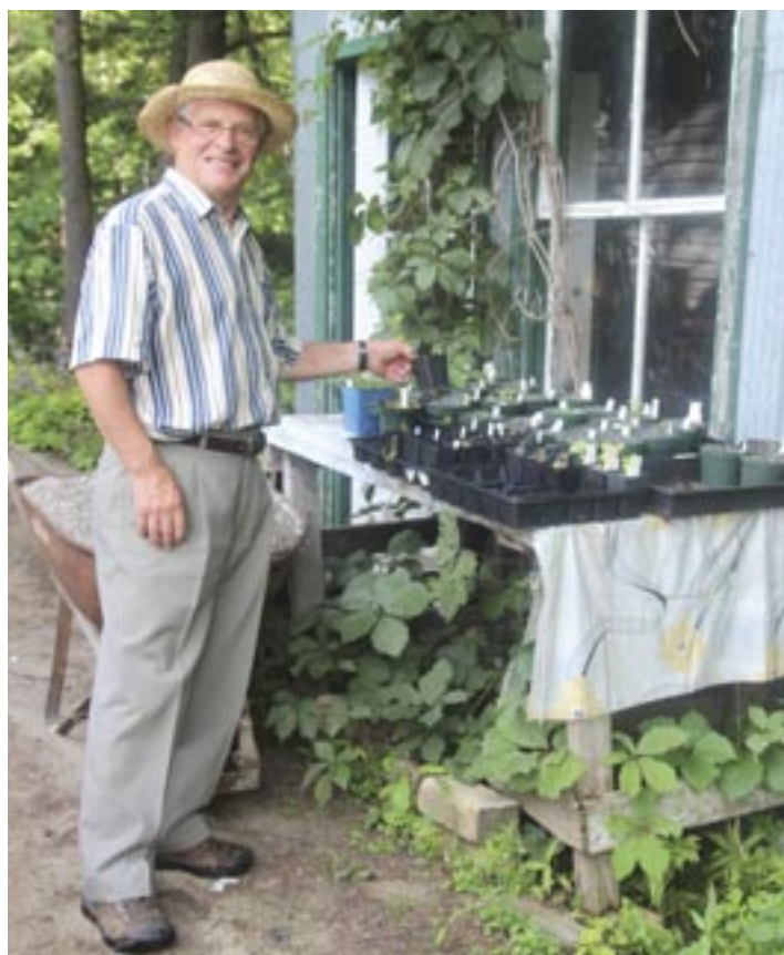
Des semis entre bonnes mains.

Sur son terrain, un bassin avec cascade ruisselante a été façonné à même un terrain pentu. Un autre bassin rempli de galets sert à épurer l'étang. Cette éventuelle lagune foisonnera d' Iris des marais .