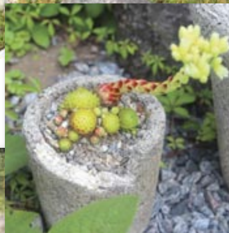
Une auge alpine remplie de sempervivum, (jourbarbe).