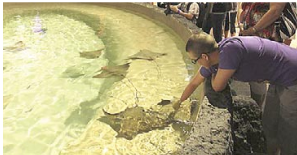
L'Odyssée Pacifique Sud.

La principale nouveauté consiste en l'inauguration récente de la section aquatique Odyssée Pacifique Sud , ouverte depuis le 18 juin. Dans une aire intérieure, on remarque dès notre entrée, d'énormes bassins vitrés qui constituent en fait les murs de l'endroit et où nagent tortues, poissons tropicaux et requins, dans un décor coloré et magnifique de coraux et de coquillages. De plus, un bassin a été aménagé à même le sol pour y abriter des raies que l'on peut flatter et même nourrir, au grand plaisir de tous. Il n'y a aucun danger à cette pratique, puisque le dard