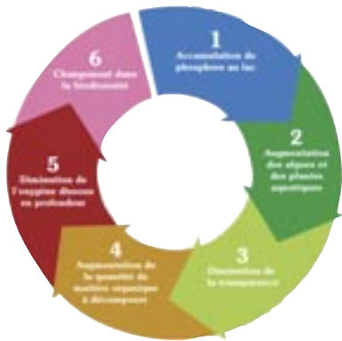
Cycle de l'eutrophisation