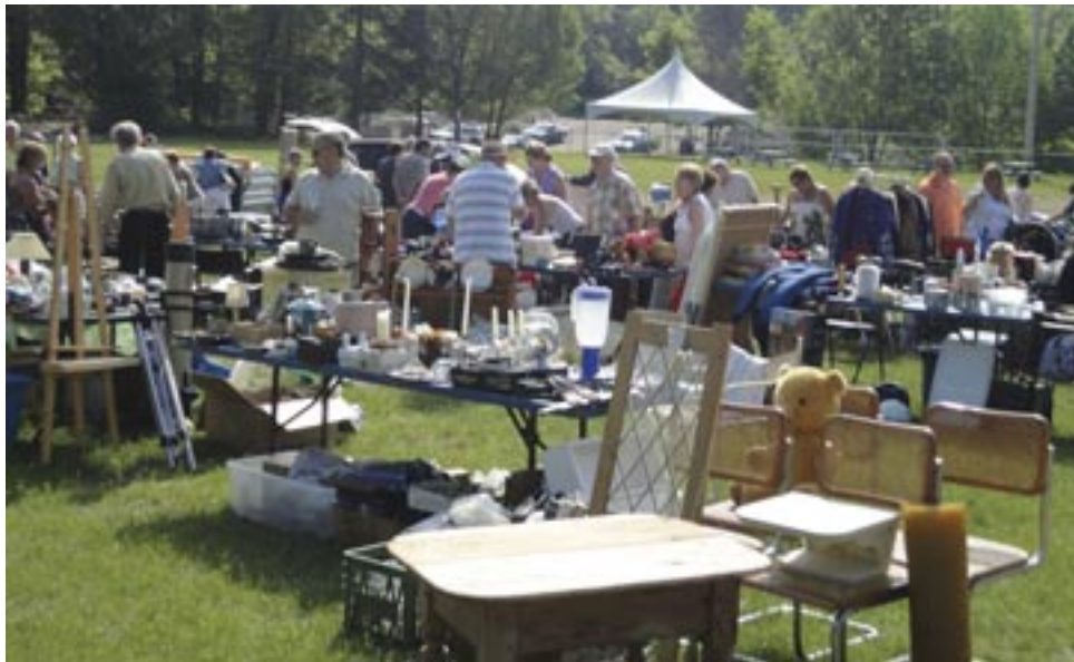
Le bazar a encore obtenu un grand succès.