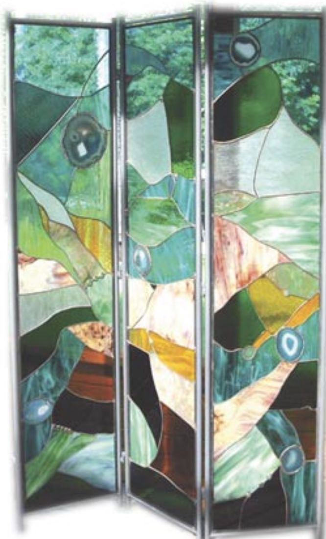
Oeuvre inédite que l'on pourra admirer à Montagne-Art.

Quand je dis que je suis maître-verrier, les gens me disent : « Ob! moi tu sais, les vitraux