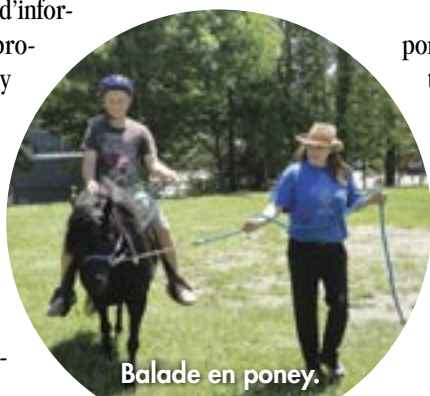
Balade en poney.

Le bazar a encore obtenu un grand succès et a permis d'augmenter les profits du club pour cette activité de 50 % par rap-