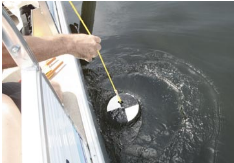
Mesure de la transparence avec un disque de Secchi.

Une eau trouble empêche la lumière de pénétrer en profondeur, de sorte que seule la sur-