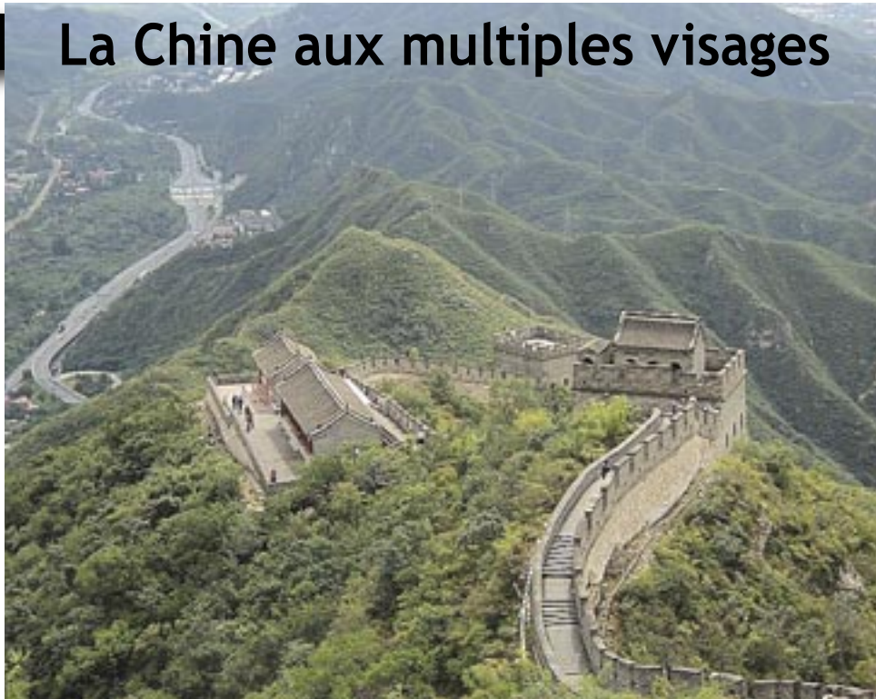
Prochaine étape, la visite d'une partie de la grande muraille de Chine.