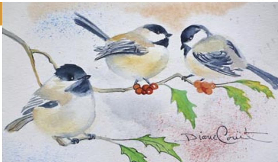
AQUARELLE DE DIANE COUËT

Un autre défi pour les oiseaux est de protéger les parties de leur corps qui ne possèdent pas de plumes. Lorsque l'oiseau est au repos, il enfonce souvent son bec dans son plumage. On voit souvent les goélands et les canards agir ainsi. En se tenant sur une patte, l'oiseau peut cacher l'autre patte dans ses plumes et alterner après un certain temps. Même si cette technique est efficace, elle n'est pas suffisante. Si nous regardons de plus près les pattes et les pieds des hérons, goélands et canards, les artères et les veines sont vraiment très proches les unes des autres. Lorsque le sang chaud artériel se rend aux pattes et jusqu'aux pieds, ce sang transfère de la chaleur aux