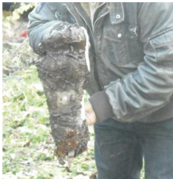
L'empreinte du Yéti

Saint-Hippolyte est devenu, pendant 24 heures le plateau de tournage d'un documentaire qui promet de piquer la curiosité! Une co-