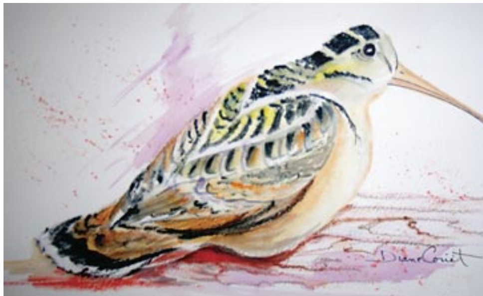
Aquarelle Diane Couët

Les bécasses sont parmi les derniers oiseaux à quitter notre région en prévision de l'hiver et ce sont aussi les plus hâtifs à revenir au printemps. Ceux qui hivernent au sud des États-Unis, quittent leur territoire dès la fin janvier afin de