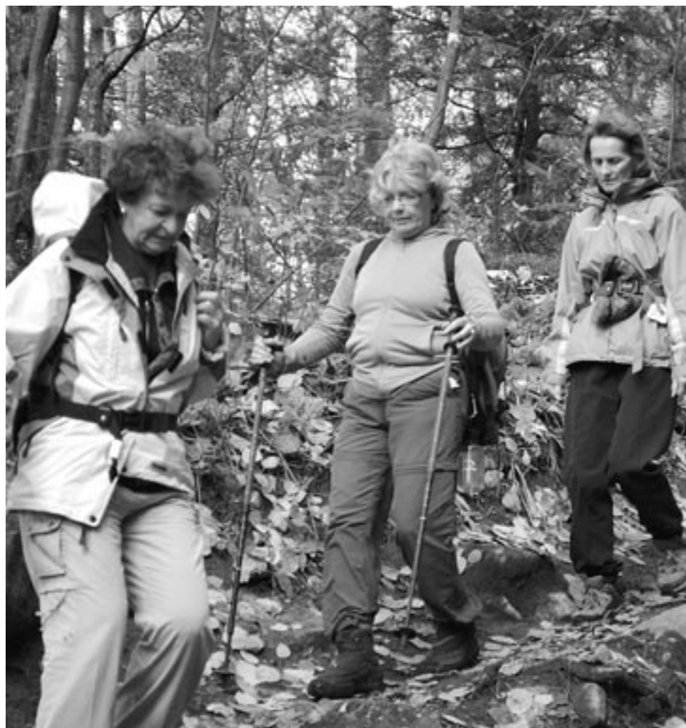
Quelques participantes au Tour du massif

Le CRPF entend mettre de l'avant l'accès démocratique aux activités de plein air, respectant l'intégrité écologique de ce territoire de 16 km 2 .