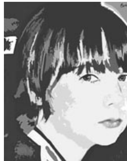
Puberté, acrylique 35 x 45 cm

Vous vous êtes déjà arrêté devant ses toiles à Montagne-Art. Faites-vous plaisir, venez visiter cette exposition, vous ne serez pas déçu!