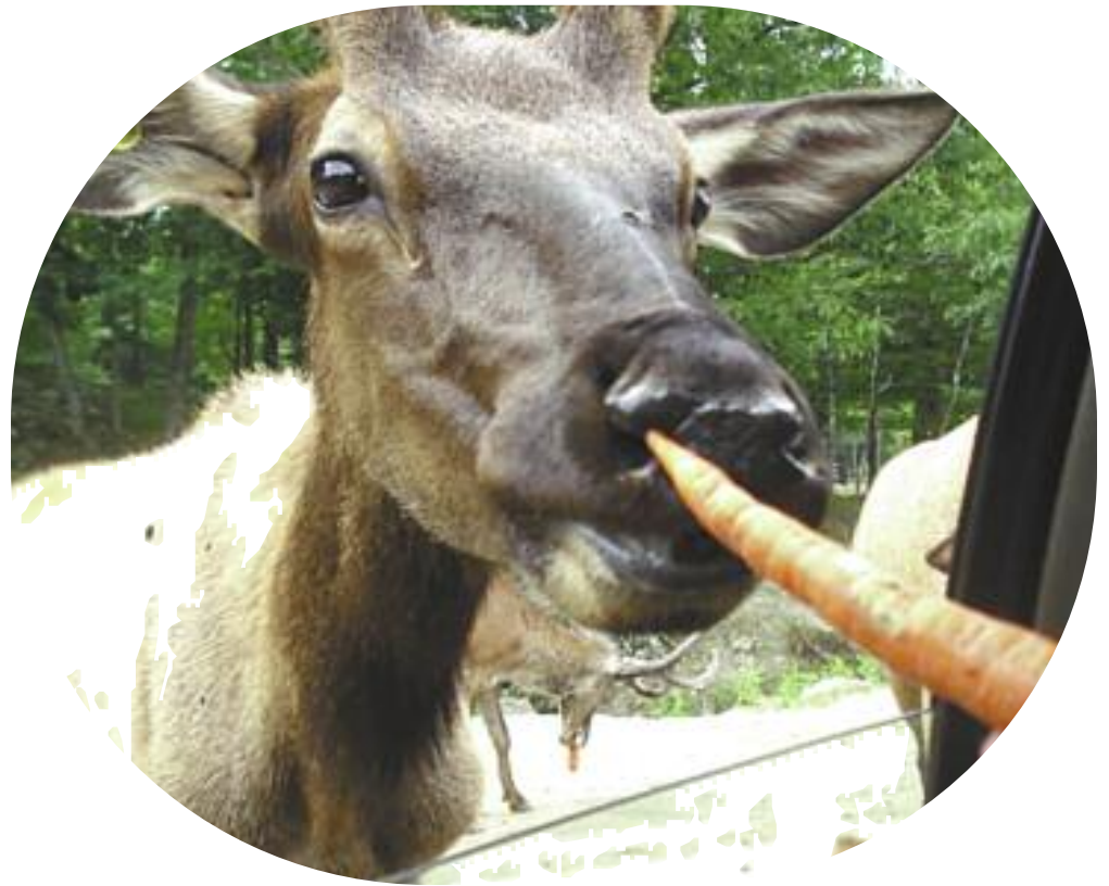
Les wapitis sont difficiles à rassasier.

Je suis allée passer une journée au Parc Oméga, à Montebello. La dernière fois que j'y avais fait une visite, j'étais toute petite, donc c'était comme nouveau pour moi d'y retourner. Le trajet de Saint-Hippolyte à Montebello fut assez long, mais ma famille et moi considérons tout de même que ça en a valu la peine!