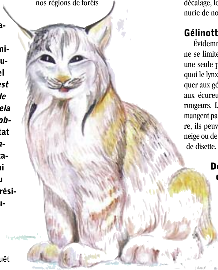
Aquarelle Diane Couët

Là où le sol est couvert de végétation et de broussailles offrant ainsi de la nourriture à ses proies et où les arbres renversés lui fournissent un abri en toutes saisons, le lynx parcourt cette forêt de conifères toute l'année, sans avoir à se terrer pendant l'hiver. Il lui arrive parfois de s'aventurer plus au nord dans la toundra arctique et plus au sud, dans nos régions de forêts