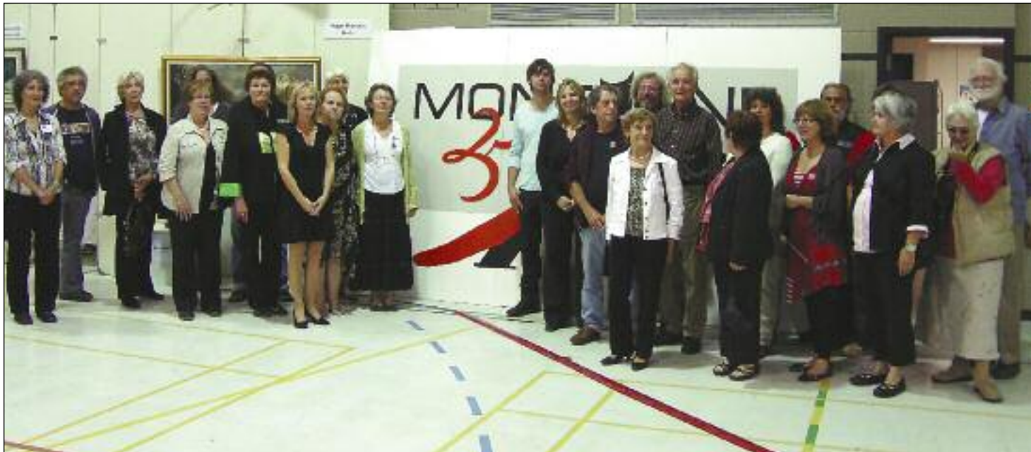
Quelques artistes présents lors du vin et fromage.

Le thème de cette année, Montagne-Art se souvient , reflétait bien la réputation de l'événement qui a accueilli pour sa 25 e édition, les artistes invités d'honneur des 24 dernières années. Près de 1200 visiteurs ont participé aux trois événements, organisés pour ce quart de siècle.