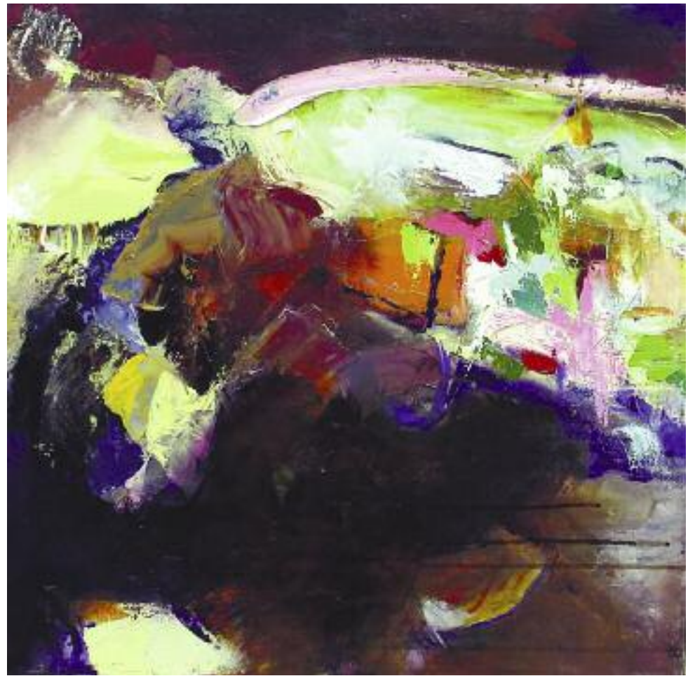
La traversée du cavalier • acrylique • 60 x 60 cm

Cette artiste, éprise d'authenticité, saura vous surprendre, vous questionner ou vous émouvoir, à votre gré.