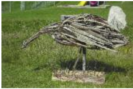
La Bernache en bois d'épave de Michel Giroux

Les peintures africaines de Jean-Claude Latour traduisent à fleur de toile, la réalité des