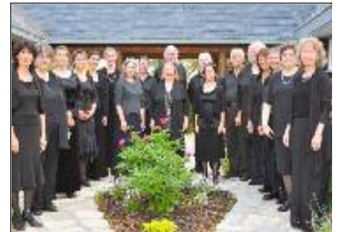
L'ensemble vocal Cantivo est formé d'amoureux du chant choral.