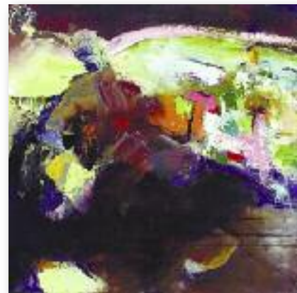
La traversée • acrylique • 60 x 60 cm