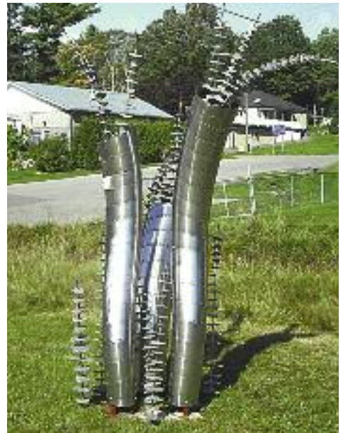
Sculpture de Roch Lanthier

du journal Le Sentier, l'exposition Montagne-Art inspire « L'harmonie de la Nature et de l'Art. »